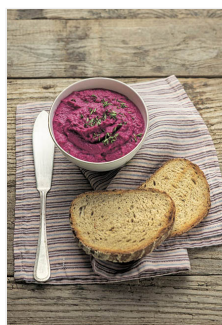
Humus di barbabietola, una delle tante gustose ricette del volume Mangiare con gusto e vivere 100 anni

Secondo volume de LA CUCINA DEL SENZA ® , collana nata da un’idea di Marcello, il libro propone piatti gustosi e saporiti senza l’aggiunta di sale, grassi e zucchero, approccio culinario basato sul concetto di qualità = gusto = salute.